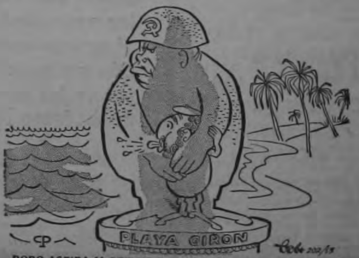
BOBO ASPIRA AL PREMIO DEL MONUMENTO A LA VICTORIA