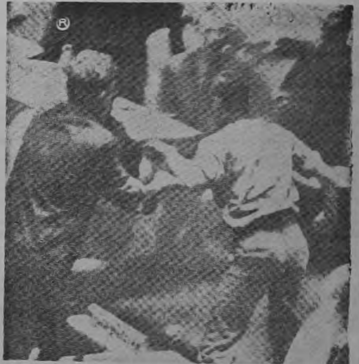
Un grupo de cubanos anticomunistas, invadió la sede de las Naciones Unidas, gritando lemas anticomunistas y repartiendo volantes de igual tono. La policía especial de la ONU les sacó por la fuerza del recinto. Pero la protesta quedó vibrando en el salón dorado y azul con el grito de un joven cubano: "Cuba es una colonia rusa en América!".